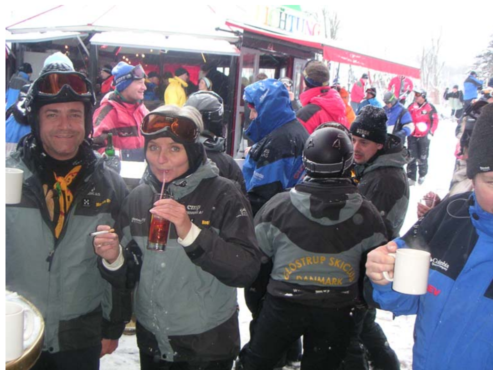
Skihajere i sit rette element.... afterski