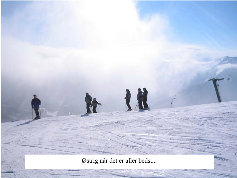
Østrig når det er aller bedst...

igennem Danmark, havde man nok lagt mærke til, at Morten snakkede ufatteligt meget i mobiltelefon og muligvis ville man sikkert havde observeret, at han også så temmelig stresset ud.