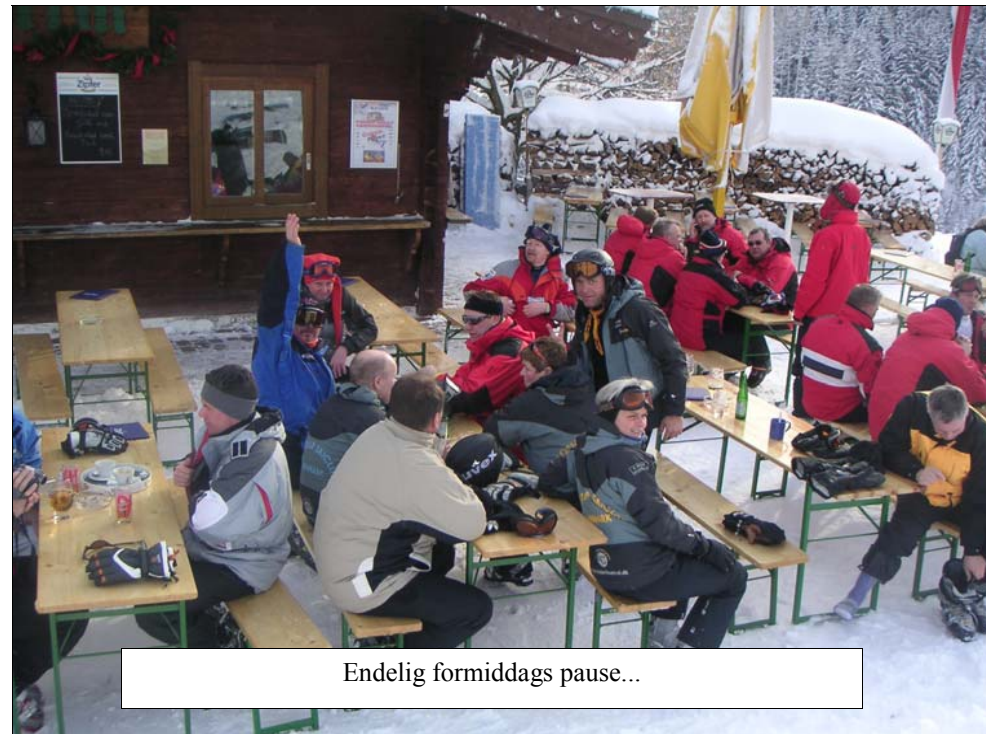
Endelig formiddags pause...

Ungdomshytten inviterede alle til cowboy