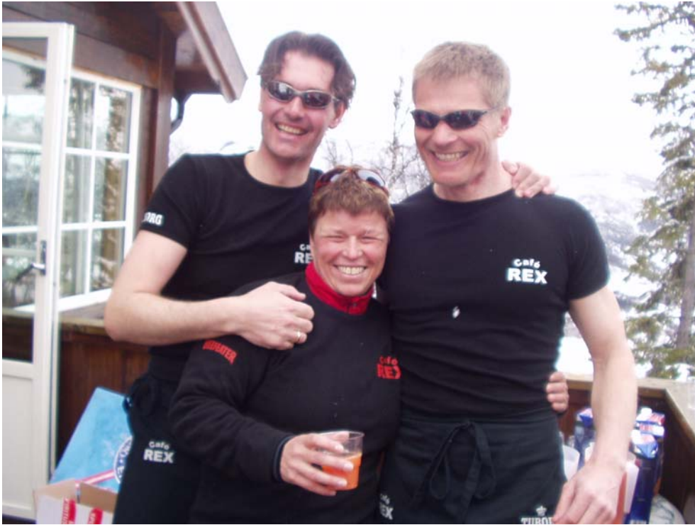
DE bare tendere...

bus med unge piger kørende op uden for vores vindue. Da bussen skulle prøve at vende var det ved at ende galt, da den skred lidt ud over kanten hen mod én af hytterne. Bussen blev tømt og der blev forsøgt skubbet til bussen, og kæder under hjulene m.m. Men det så godt nok lidt ud til at være forgæves, men det lykkedes alligevel til sidst til stor jubel for de unge piger – men mændene i vores hytte synes ellers det kunne have været hyggeligt med lidt ”ungt” selskab...☺