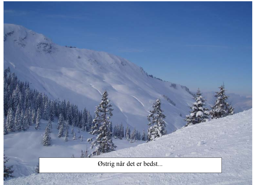
Østrig når det er bedst...

Jeg tror, at hvis man havde været en smule opmærksom på den første del af turen ned