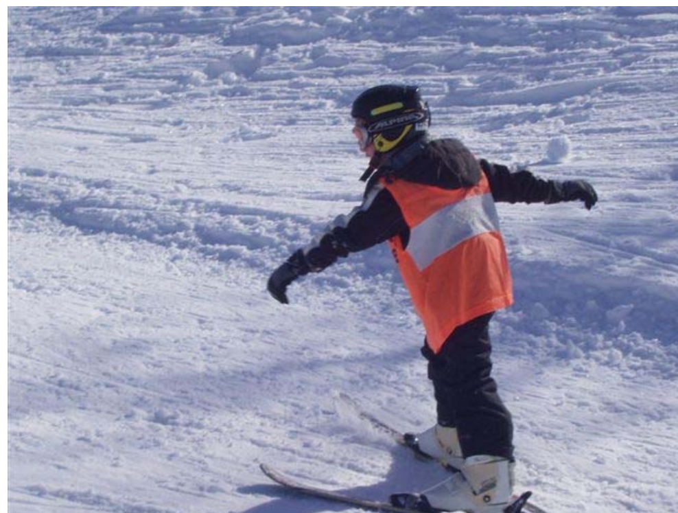
Hemsedal for alle aldre...