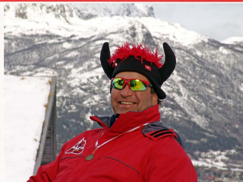
Tyren fra Hemsedal...